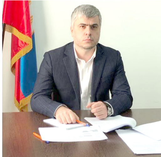
Республикабызны ёлбашчысы Сергей Меликов шо гон оьтгерил-